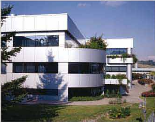
qs group: head quarter qs group: sede centrale